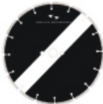
ASFALT + BETON LAR